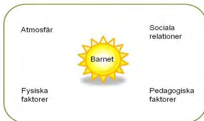
Bild 1. Inlärmingsmiljön i förskoleundervisningen

De pedagogiska faktorerna i inlärmingsmiljön bestäms utgående från de vuxnas människo- och inlärmingsyn och från det sätt på vilket dessa syns via planering överförs i praktiska förhållningssätt. Inlärmingsmiljön utvärderas regelbundet. Den information som utvärderingen ger styr utvecklingen av inlärmingsmiljön.