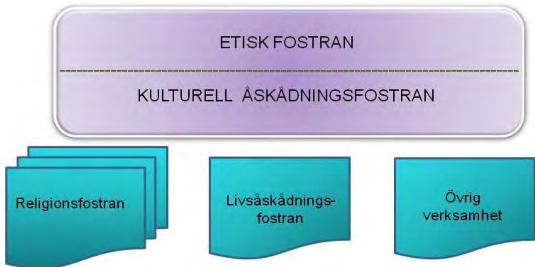
Bild 3. Etik och livsåskådning, principen för arrangemangen

Religionsfostran i enlighet med olika trossamfunds bekännelser eller livsåskådningsfostran erbjuds i förskoleundervisningen differentierat enligt vårdnadshavarens val. Undervisningen utgår från diskussioner med vårdnadshavarna om förskoleundervisningens etiska och åskådningsmässiga mål och innehåll. Diskussionen förs senast i samband med att av inlärningsplanen för barnets förskoleundervisning görs upp.