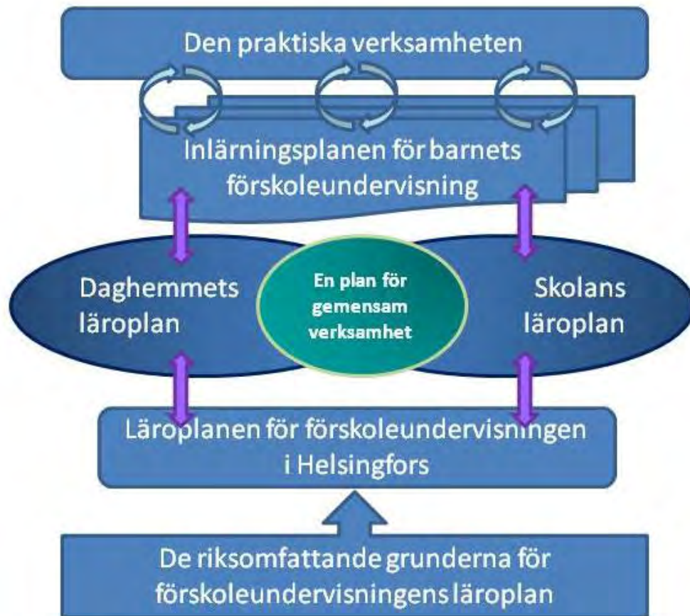
Bild 6. Läroplanens nivåer

Utvärdering, uppföljning och utveckling av läroplanen är en fortgående process i skolorna och daghemmen.